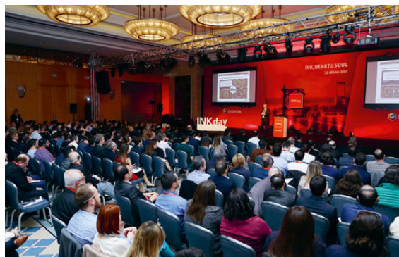
Siegwerks INKday in Istanbul, Türkei