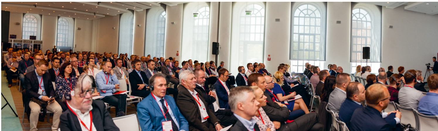
Siegwerks INKday in Lodz, Polen

Bitte beachten Sie unser Interpack-Video auf Youtube: https://www.youtube.com/watch?v=cwG6ITGBzDg&feature=youtu.be