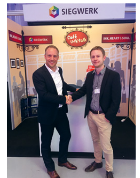
UV Days bei IST Metz, Deutschland