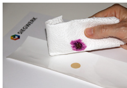
Je heller der Fleck, desto besser ausgehärtet ist das Deckweiß/der Lack.

Zur Kontrolle der korrekten Aushärtung von UV-Deckweiß und UV-Drucklacken erstellt man zunächst ein Referenzmuster, indem man auf einen vollständig ausgehärteten Druck einen Tropfen 5%ige Kaliumpermanganat-Lösung (KMnO 4 ) träufelt und nach 30 Sekunden abtupft. Da Kaliumpermanganat ein starkes Oxidationsmittel ist, färben sich nicht vernetzte Acrylat-Doppelbindungen dunkel und