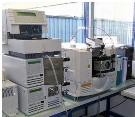
Uno dei tanti spettrometri LC-MS per l'analisi della migrazione

In quanto fabbricante leader di sistemi di inchiostri a bassa migrazione, Siegwirk pone la massima cura nel rendere i propri inchiostri per la stampa affidabili e sicuri da ogni punto di vista. In tutti i laboratori Siegwirk si utilizzano pertanto modernissimi apparecchi di controllo. Ogni lotto di produzione di inchiostri UV a bassa migrazione viene controllato singolarmente. Il controllo cromatografico dei lotti rileva l'eventuale presenza di sostanze potenzialmente migranti nell'inchiostro, che mostrino un cosiddetto «picco». Se si evidenzia un valore di picco di una sostanza migrante, il lotto corrispondente viene scartato.