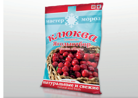
Пример печатной упаковки с использованием офсетных УФ-красок

Компания Siegwirk непрерывно работает над улучшением своих печатных красок и разработкой новых решений. Сочетание современных УФ-красок для офсетной печати Siegwirk и полиуретановых белых красок на основе растворителя (PUR) позволяет производить высококачественные ламинаты со значениями прочности ламинации более 2 Н/15мм на таких пленках, как соех-OPP, PET и даже ОРА. Улучшенная функциональность упаковки еще больше повышается за счет исключительной плотности белого цвета